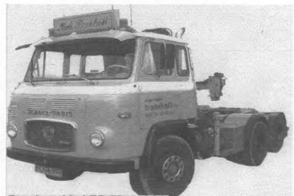
Scania-vabis LBS 76 s 1967.