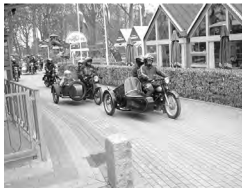
Afgang i fin stil! Tak for en go´dag!