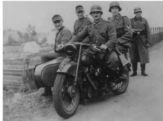
En Nimbus motorcykler fra 1938 magen til dem, som Frikorps Danmark fik med sig i krigen på tysk side. Dette er dog ikke Frikorps Danmark soldater !