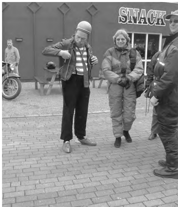
En "ægte original" var der også eller var der flere?