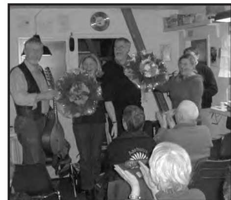
Velfortjent fik pigerne en "dusk"