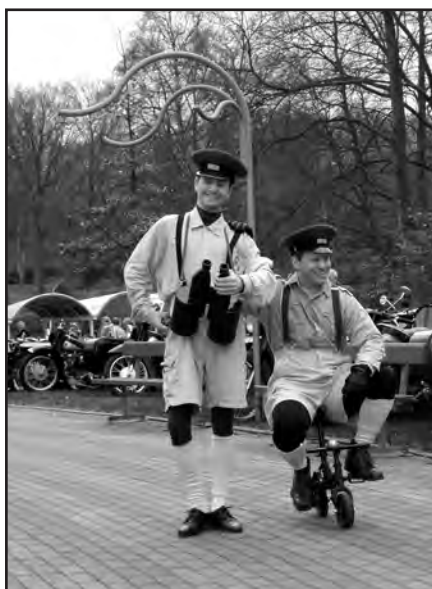
Havens to glade klovne !