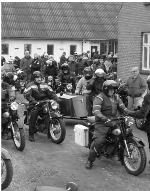
Så er det lige før vi kør´ud på turen!