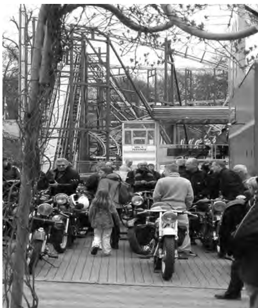
Maskinerne tiltrak publikum! (Naturligvis)