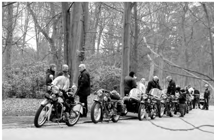
Hygge-snak i Mindelunden lige før afgang til Friheden!