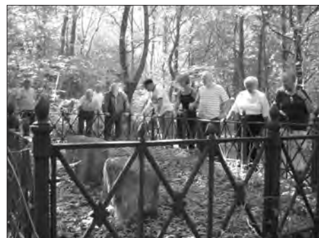
Et sjældent syn, medlemmer af Å.N.K. på gå-ben og samlet på en kirkegård i en skov og i højt solskin!