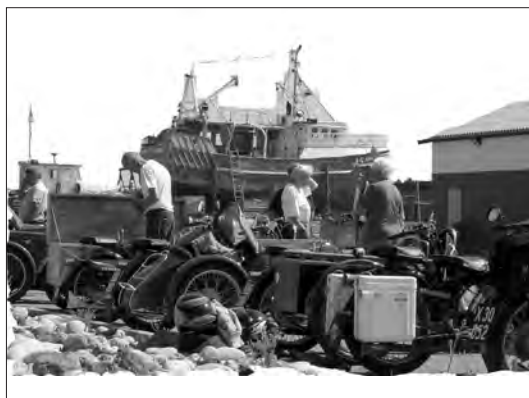
Vi spiste frokost på havnen!