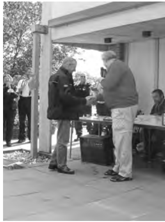
Vinderen af fighter-præmien!

Med Dan's store forarbejde, blev deltagerne i dette års Pokalløb udrordret udi brugen af: