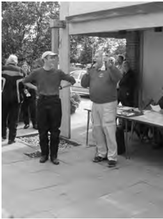
Vinderen af pokalen!