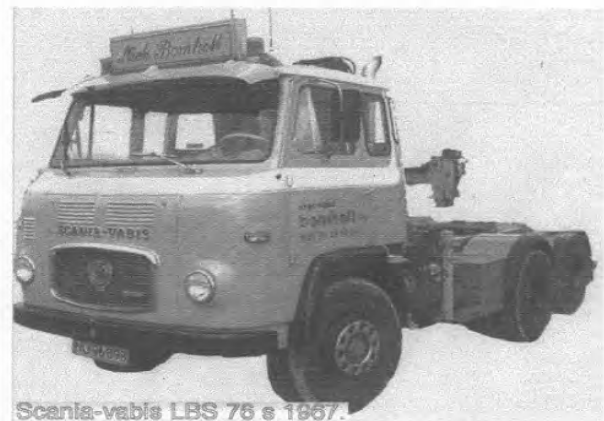
Scania-vabis LBS 76 s 1967.