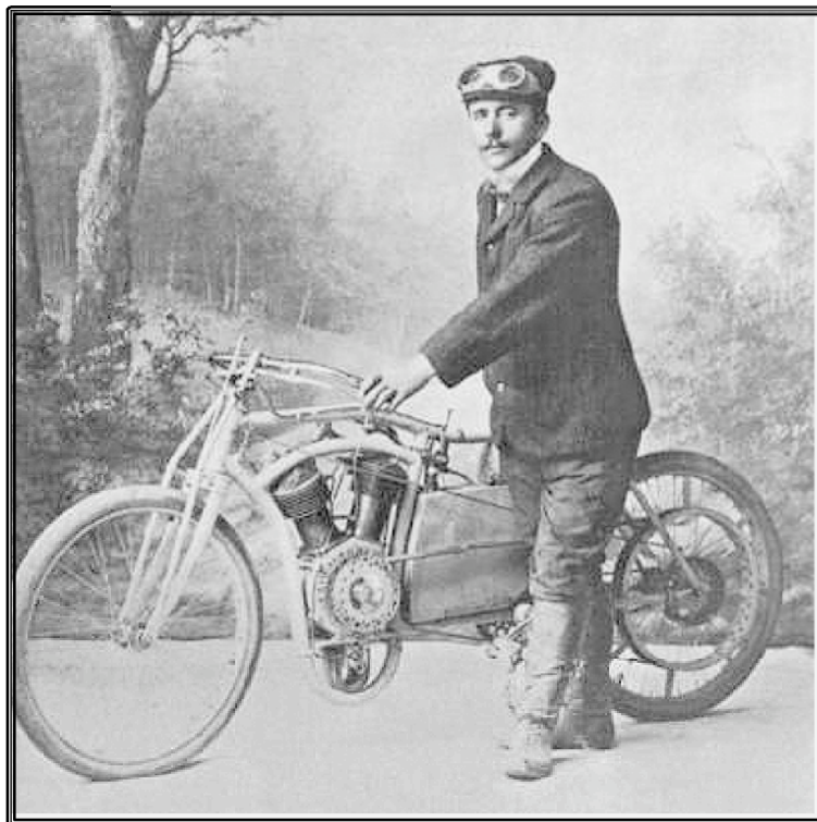
En Laurin & Klement motorcykel!

Historien begynder i slutningen af 1895. En mekaniker, Václav Laurin, og en bogholder Klement, begge entusiastiske cykelryttere begynder at producere deres egne cykler, som de patriotisk kalder Slavia.