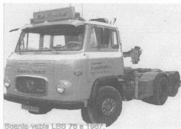
Scania-vabis LBS 76 e 1967.