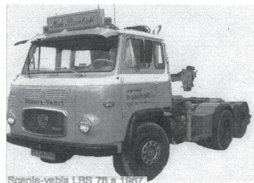
Scania-vabis LBS 76 s 1967.