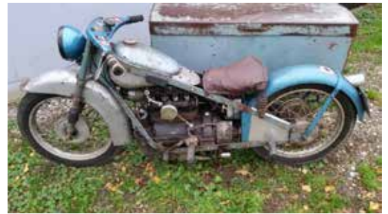
Som den så ud før...