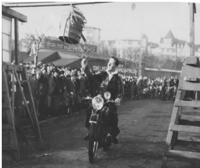
Der følger ingen billede tekst til dette billede, men sikkert på havnen et sted, med kendte bygninger i baggrunden.