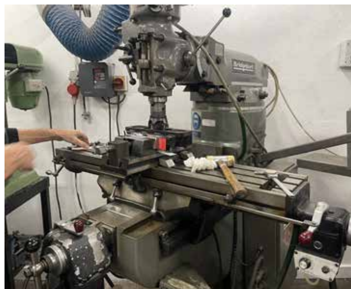
Så er "patienten fastspændt og klar til det "store snit"...