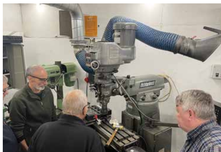
Operationen blev fulgt af flere, som var vidne til at operationen lykkedes og at dette topstykke igen er klar til mange km.