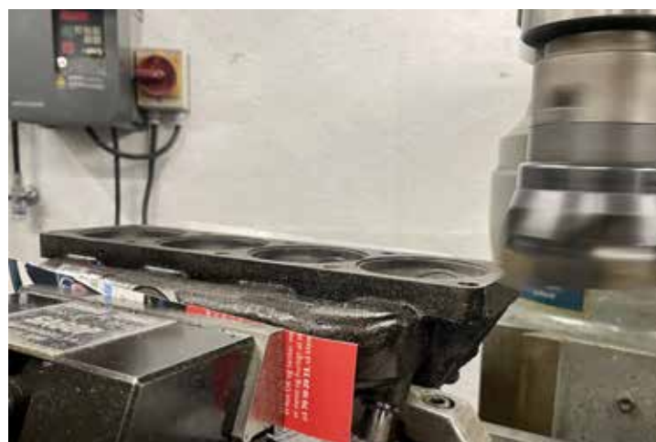
Fræserhovede fræser lidt af gangen og der køres fem og tilbage af flere gange.