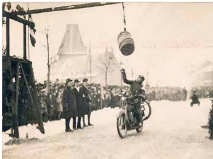
Der følger ingen billede tekst med dette billede, men på havnen et sted, med Toldbygningen i baggrunden.

Der blev også holdt fastelavn i hvert fald i 1952, hvor man var flyttet til Friheden i stedet for "Den forblæste havneplads", men ellers var der ophold i arrangementerne indtil 1958, hvor klubben havde erhvervet Ny Mølle. Fra dette arrangement findes tre billeder leveret af Henning Elmstrøm.