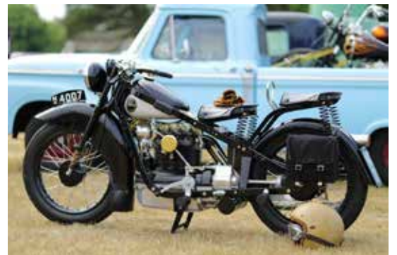
Som den er nu....

Hjemme på Djursland igen ca. kl 23, stadig i støvregn, bælgravende mørke og temperatur tæt på frysepunktet, blev baghjulet på min "nye" Nimbus hurtigt monteret igen så en lille testtur kunne foretages. Jeg blev faktisk temmelig forskrækket da den efter et enkelt tråd på kickstarteren sprang i gang! Hurtigt op på dyret og afsted ned ad vejen uden hjelm eller handsker (fingrene var alligevel allerede følelseløse efter at have monteret baghjulet). Jeg nåede (næsten) op i andet gear, for efter 35-40 meters kørsel løb Nimbussen tør for benzin. Endnu mere våd og kold end før, måtte der trækkes hjem i garagen. Denne lille tur blev faktisk den eneste jeg fik på min nyindkøbte Nimbus de næste ca. 2 år.