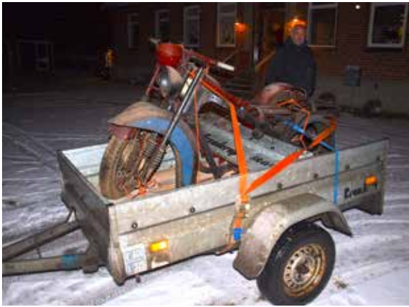
En kold vinteraften i 2017 startede projekterne....