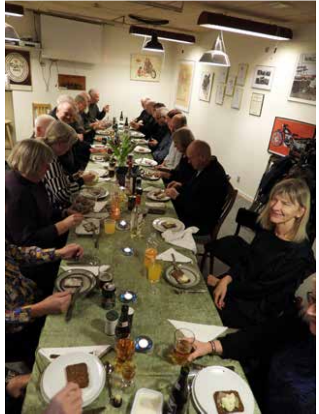
Mange glade medlemmer i godt selskab.

Der blev næsten spist op af alle de gode sager.