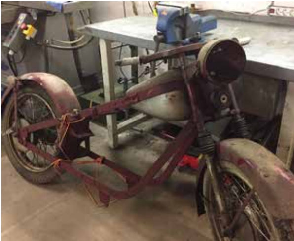
Hjembragt, men i en lidt træt og sørgelig forfatning