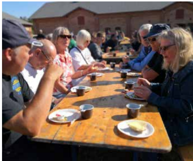
Morgenmad og morgenstemning, hvor mange af klubbens medlemmer var mødt op på deres Nimbusser.