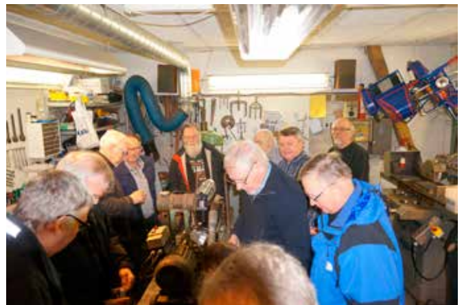
Hele forløbet igennem var der stor deltagelse og mange timer blev lagt i projektet.....