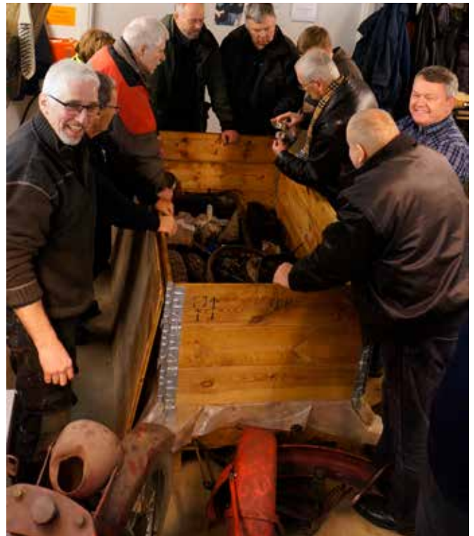
De spændende da kasserne bliver åbnet..... det var som var det juleaften.....