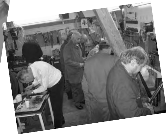
Billederne er fra et tidligere skruerkursus