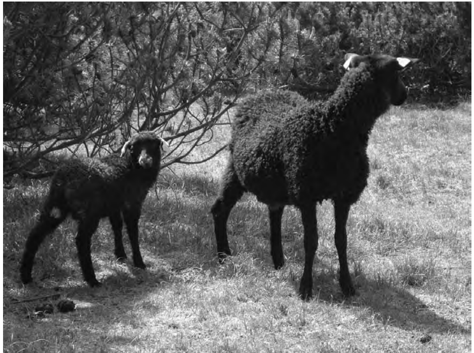
Fastlandets sorte får