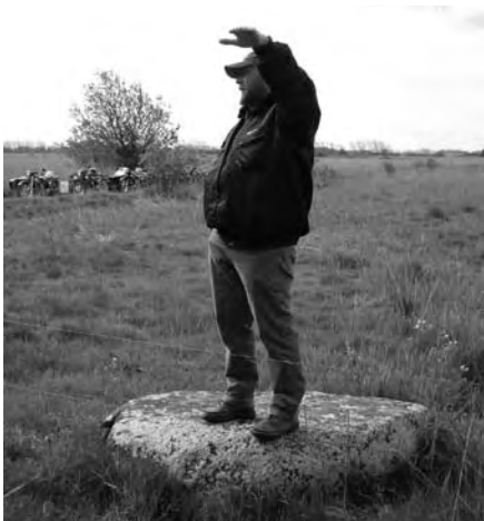
"Så stor var frugtbarheden engang"