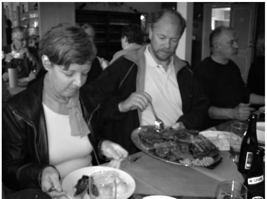
Og så blev der spist!