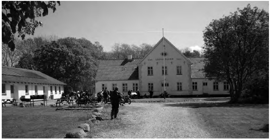
Louisenlund, var det her, der var løver?