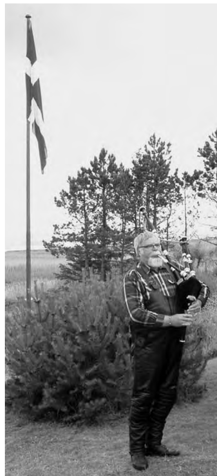
Redaktionen er blevet bekendt med, at dette efter skrigende skulle forestille en formand med en ægte skotsk sækkepibe og ikke klubbens nyeste kaffemaskine.

Det var baggrunden for min opfordring til jer om at benytte sommertiden til at få kørt noget.