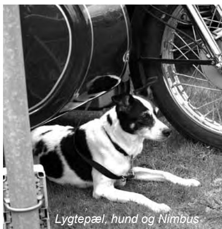
Lygtepæl, hund og Nimbus