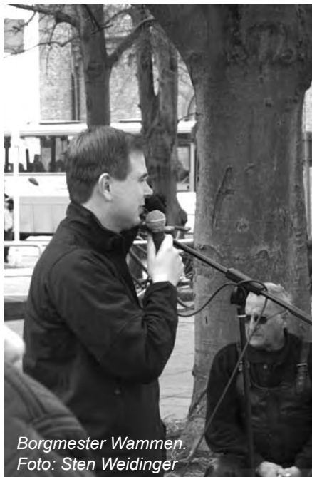
Borgmester Wammen.

Det er uden sammenligning den bedste rute vi nogen sinde har kørt. For det første er det en meget smuk køretur, og for det andet er det en rute uden mange trafiklys,