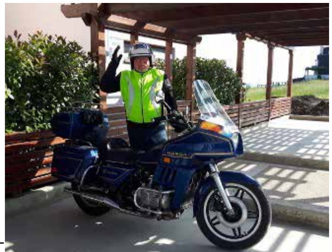
Gold Wing Interstate