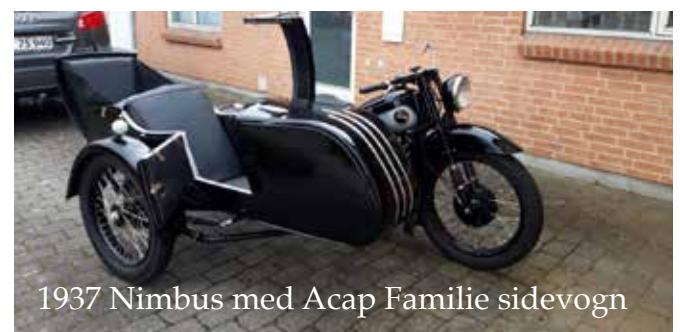
1937 Nimbus med Acap Familie sidevogn