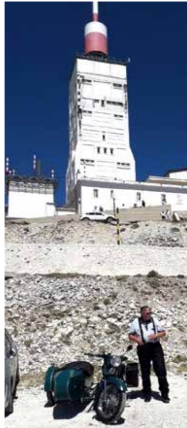
Mount Ventoux, Frankrig på 1952 Nimbus med Acap sidevogn

Stor tak til alle. Det er en fornøjelse at mødes med jer.