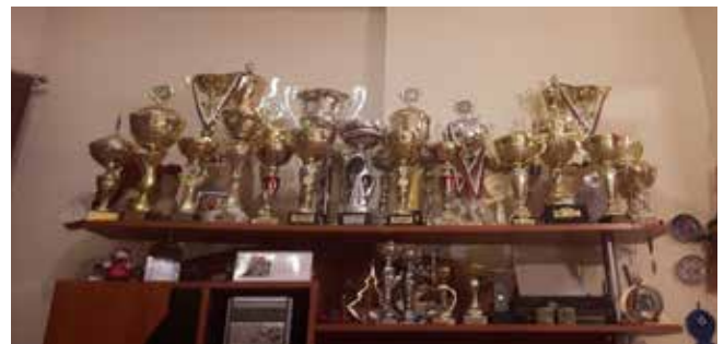
Udvalg af pokaler fra rallyeri Bulgarien.