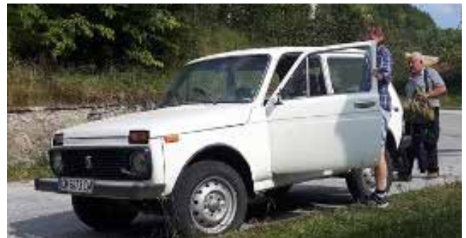
Jagtjeepen. Lada Niva