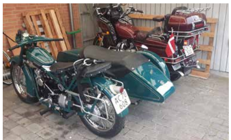
Gold Wing Aspencade samt favorit Nimbus