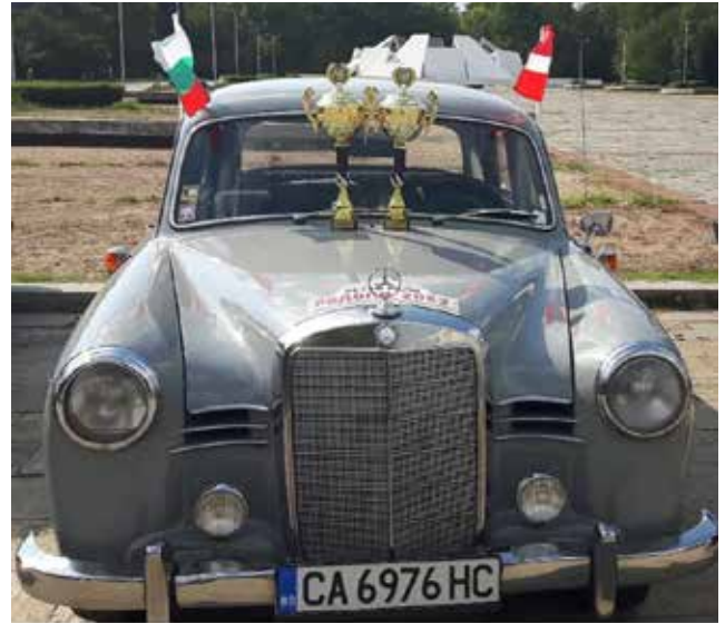
Rhodopy Rally, Bulgarien september 2023. Vi vandt vores klasse.

Selv om jeg allerede i 2018 flyttede til Frankrig fik jeg dog kørt en del på min ny erhvervelse i Danmark og fandt her ud af at køre på en solo maskine i Danmark var yderst besværligt med de utallige lyskryds, stopskilte mv med heraf følgende stop og nedsænkning af ben. Jeg ledte derfor efter en sidevognsmaskine og fandt en Nimbus 1952 med Acap sidevognskasse på et Nimbus stel allerede i 2018. Denne maskine er min absolut favorit, og den har været med mig på mange ture i udlandet, bl.a i Frankrig hvor den besteg Mount Vetoux (kendt fra Tour de France), besøgte mange vinslotte og -gårde i hhv Frankrig og Bulgarien samt besøgt det sydøstligste punkt af kontinental EU ved grænsen til Tyrkiet. Som anført i en artikel i Aarhus Nimbus klubblad nummer 112 har denne Nimbus endvidere opnået at blive kåret til årets (2023) mest attraktive veteran motorcykel i Bulgarien. Maskinen er pt