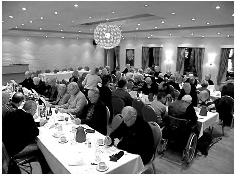
Der var 58 deltagere til spisningen før generalforsamlingen, og med de der stødte til efter spisningen blev deltagerantallet på årets generalforsamling en ny klubrekord - FLOT