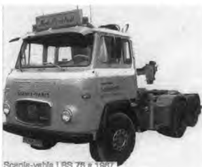
Scania-vable LBS 76 e 1987.