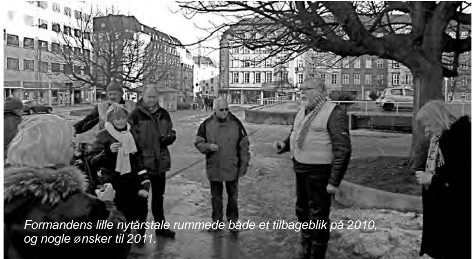
Formandens lille nytårstale rummede både et tilbageblik på 2010, og nogle ønsker til 2011.

Skal vi promovere klubben i et forsøg på at trække nye og yngre medlemmer til, eller skal vi slå os til tåls med de medlemmer vi har, og nyde vore Nimbusers mens vi stadig kan?