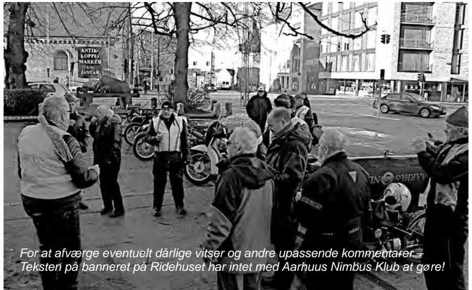
For at afværge eventuelt dårlige vittser og andre upassende kommentarer – Teksten på banneret på Ridehuset har intet med Aarhus Nimbus Klub at gøre!

Bestyrelsen her ikke noget svar parat, men det har medlemmerne måske, og derfor opfordrede formanden da også til, at alle i klubben tager del i den snak.