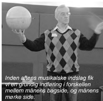
Inden aftenens musikalske indslag fik vi en grundig indføring i forskellen mellem månens bagside, og månens mørke side.

Stykket "The Dark Side of the Moon" blev skrevet som en kommentar til tidens gang, konflikt, grådighed og psykisk sygdom. Og inspirationen havde ikke mindst sin baggrund i, at bandets tidligere tekstforfatter og hovedsangskriver, Syd Barret, på det tidspunkt var blevet ramt af en alvorlig psykisk lidelse.