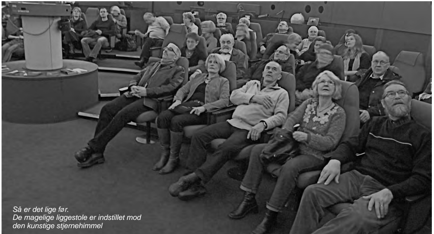
Så er det lige før. De magelige liggestole er indstillet mod den kunstige stjernehimmel

Ikke færre end 24 af klubbens medlemmer havde tilmeldt sig fuldmånearrangementet d. 19. januar på Steno Museet i Aarhus.