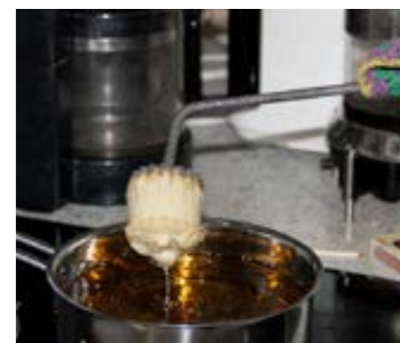
15 - 20 sekunder i den varme olie. Vupti - en gylden krustade.