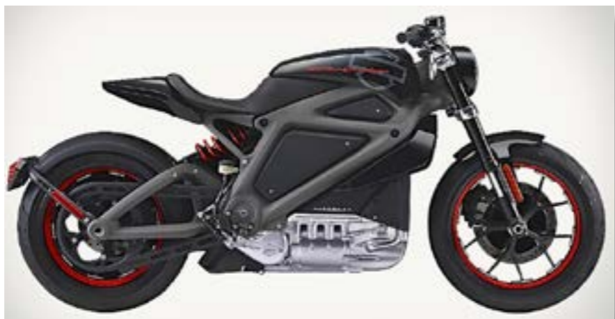
"Kardantrek", og en stelramme på den nye Harley Davidson.