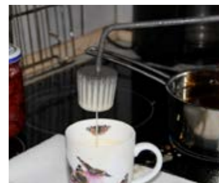
Den tynde dej i et krus, den varme olie i kasserollen.