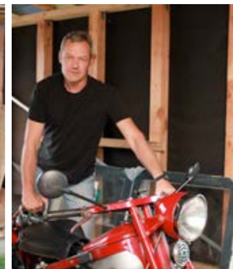
Det har taget tid at få Bussen i den ønskede stand.