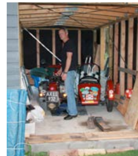
Det nye Nimbushus

Som han selv siger "Jeg kan godt lide at sætte folk, der står og mangler noget, i forbindelse med andre, der har alt for meget, og kan man så tjene en skilling på det, er det jo helt fint".