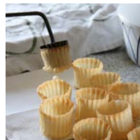
En krustade er en lille brødkurv.