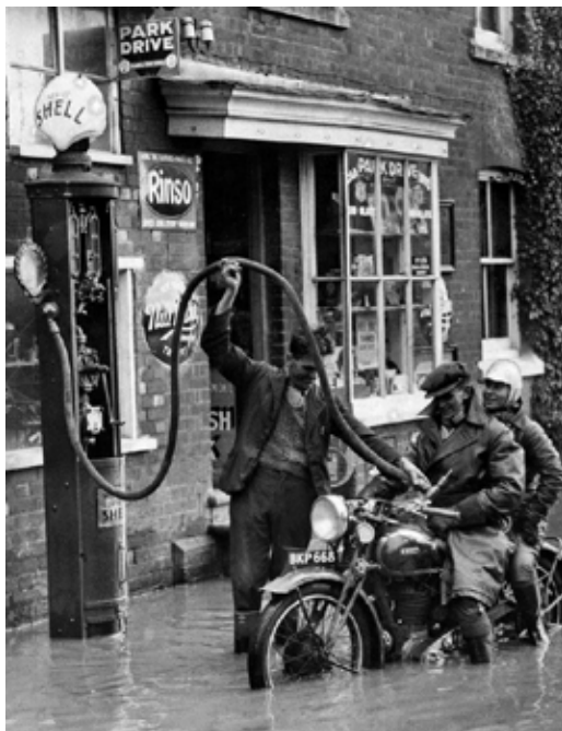
Det har været en våd sommer